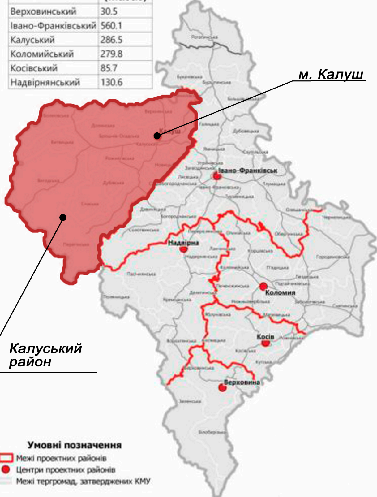
СХЕМА РОЗТАШУВАННЯ КАЛУСЬКОГО РАЙОНУ В ІВАНО-ФРАНКІВСЬКІЙ ОБЛАСТІ